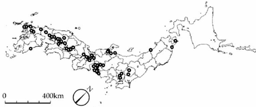
図1 日本における湧水湿地の分布。環境庁自然保護局（1995）に基づく。湧水湿地は市町村ごとに1つのマーカーで示した（同一市町村内に複数の湿地が存在する場合を含む）。